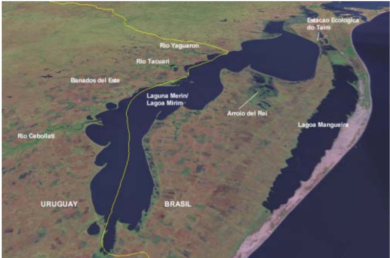
Imagen oblicua, desde el Sur, de la Laguna Merin hacia el Norte. La ubicación del límite Brasil-Uruguay es aproximada. Imagen de la herramienta de visualización WorldWind 1.3, NASA.

Un componente del Proyecto sobre Sensoramiento Remoto para el Manejo de los Tratados y la Conservación Transfronteriza